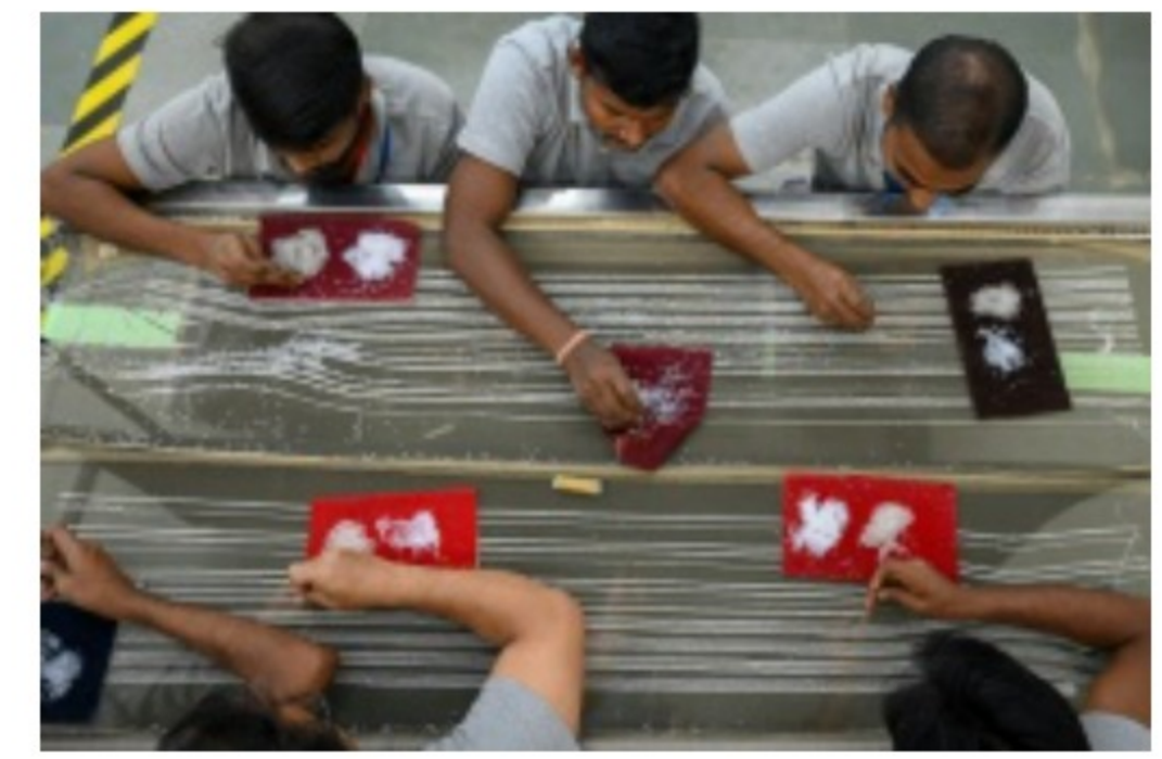
Des brodeurs de l'atelier Shanagar travaillent sur une pièce de tissu pour le couturier français Julien Fournié, le 7 janvier 2023 à Bombay, en Inde