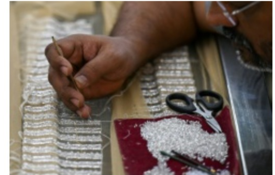
Un brodeur de l'atelier Shanagar coud des perles sur une pièce de tissu pour le couturier français Julien Fournier, le 7 janvier 2023 à Bombay, en Inde