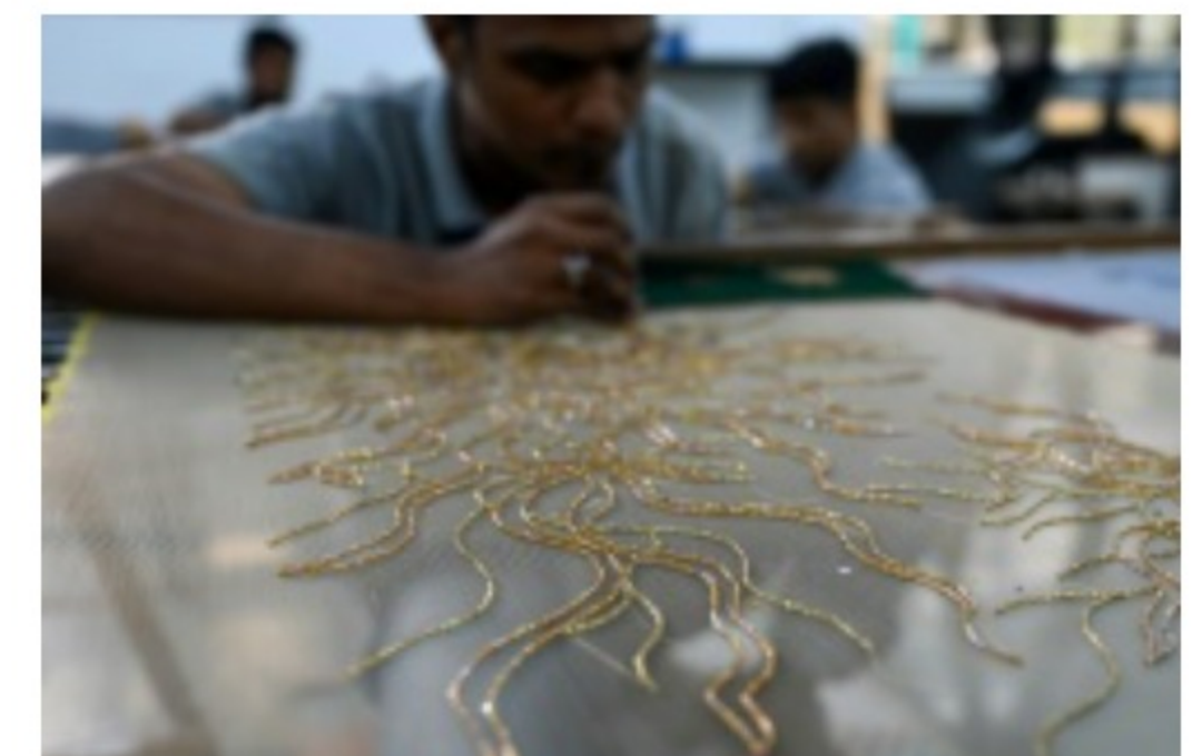
Un brodeur de l'atelier Shanagar travaille sur une pièce de tissu pour le couturier français Julien Fournier, le 7 janvier 2023 à Bombay, en Inde