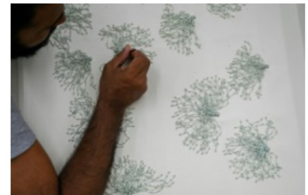
Un brodeur de l'atelier Shanagar coud des perles sur une pièce de tissu pour le couturier français Julien Fournier, le 7 janvier 2023 à Bombay, en Inde